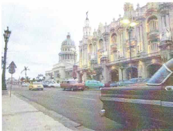
(ハバナにあるアリシア・アロレス・) ハバナ大劇場と旧国会議事堂前を走るクラシックカー

キューバの国土面積はわが国本州の約半分と結構広いこともあって、今回、訪問できたのはキューバ島の西半分にとどまった。さらにキューバの仕事の仕方や慣習などから日本での事前のアポイントはほとんど効力がなく、現地に着いて直接交渉した上でやっと決まるという「その日暮らし」が当たり前だった。とにかく訪問してみて、交渉しているうちに結果的にヒアリングできたというのが実情である。先方が忙しくて時間がない、5分、10分だけと