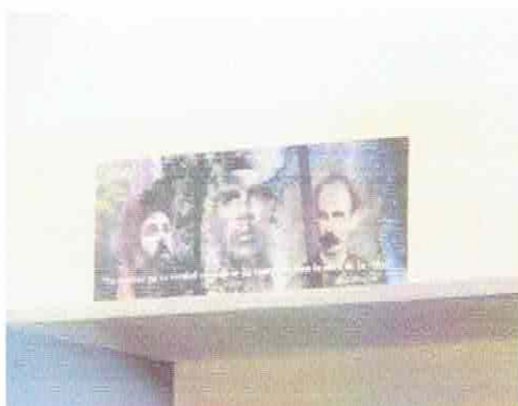
学校のあちこちに貼られたカストロ、ゲバラ、ホセ・マルティの絵